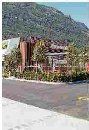
Il Mc Donald's di Domo

L'allarme alle 19,30 di ieri, poi le ricerche e infine il ritrovamento del corpo senza vita di un pensionato, appassionato di pesca, nel laghetto delle Prelle tra la Bicocca e Olengo a Novara. Sul posto la polizia e vigili del fuoco. Fino a tarda sera non erano stata resa nota l'identità dell'uomo. Tra le ipotesi in base ai primi riscontri: un suicidio o un malore. [R.L.]