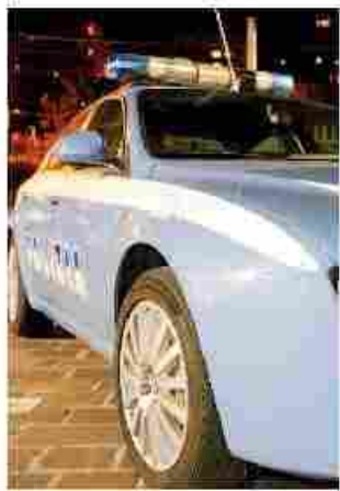
La polizia per i rilievi